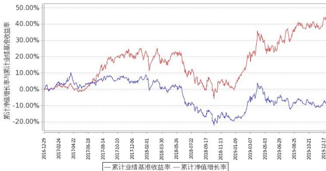
图 1：嘉实物流产业股票 A 基金份额累计净值增长率与同期业绩比较基准收益率的历史走势对比图