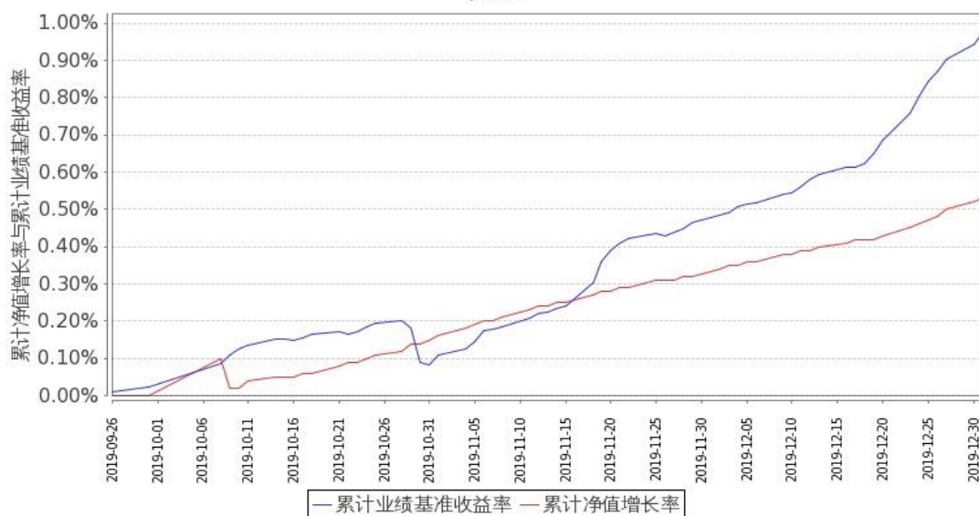
图 1：嘉实汇鑫中短债债券 A 基金份额累计净值增长率与同期业绩比较基准收益率的历史走势对比图