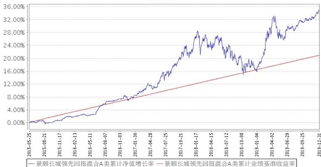
景顺长城领先回报混合A类累计净值增长率与同期业绩比较基准收益率的历史走势对比图