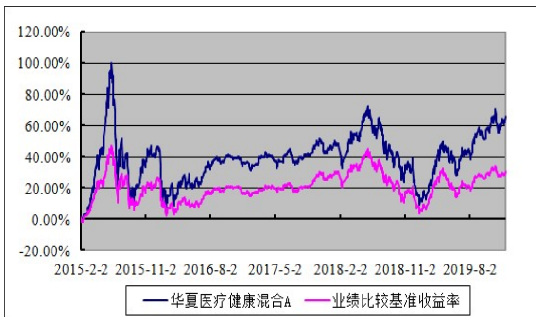
华夏医疗健康混合C: