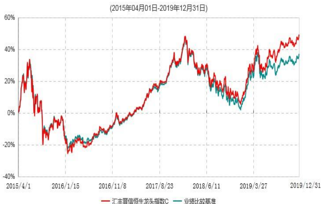
汇丰晋信恒生龙头指数C累计净值增长率与业绩比较基准收益率历史走势对比图