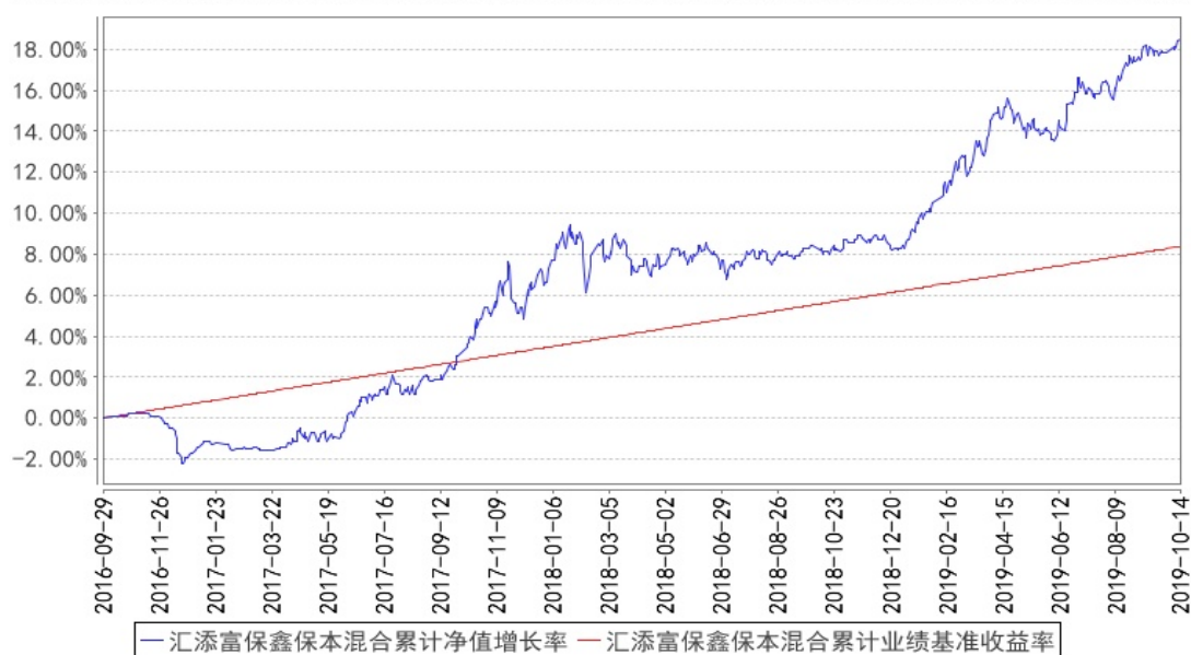
汇添富保鑫保本混合累计净值增长率与同期业绩比较基准收益率的历史走势对比图

注：本基金建仓期为本《基金合同》生效之日（2016年9月29日）起6个月，建仓结束时各项资产配置比例符合合同规定。