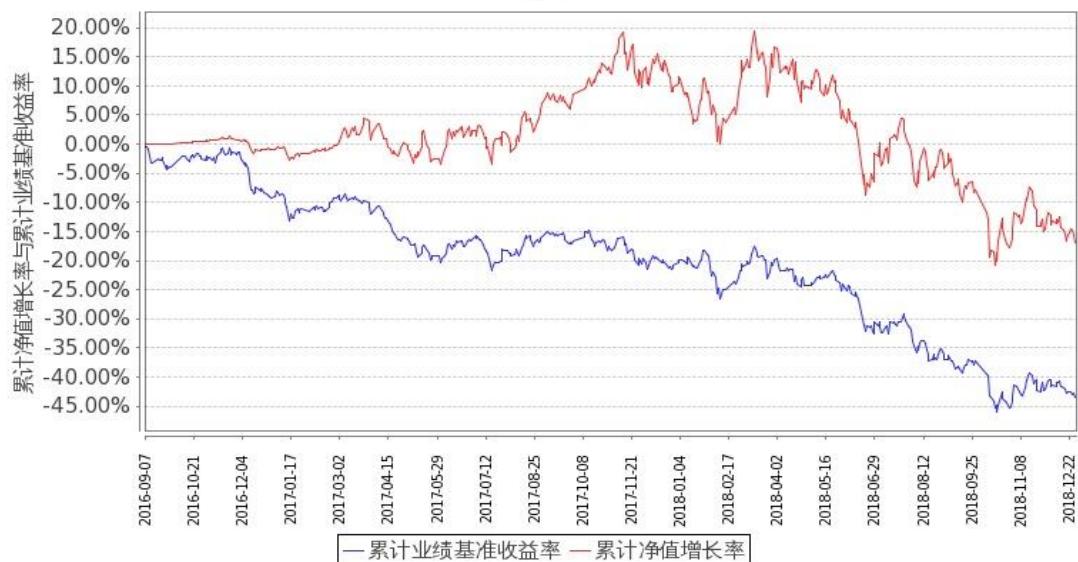
图 1：嘉实文体娱乐股票 A 基金累计份额净值增长率与同期业绩比较基准收益率的历史走势对比图