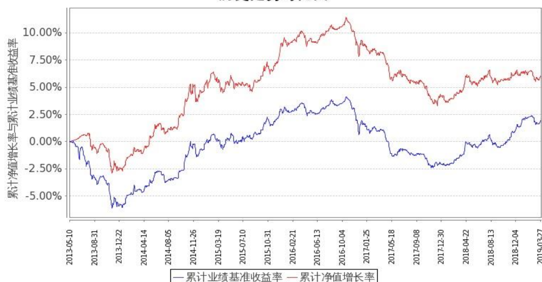
图 2: 嘉实中证金边中期国债 ETF 联接 C 基金份额累计净值增长率与同期业绩比较基准收益率的历史走势对比图 (2013年5月10日至2019年3月31日)

注: 按基金合同和招募说明书的约定, 本基金自基金合同生效日起 3 个月内为建仓期, 建仓