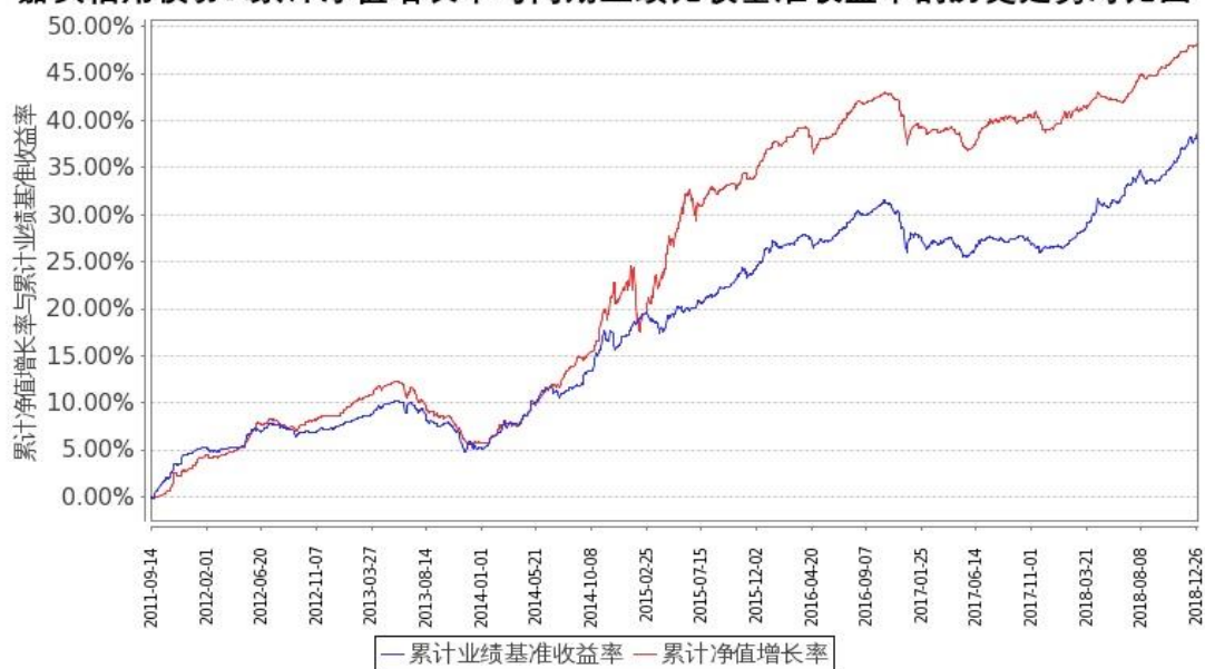
图 1: 嘉实信用债券 A 基金份额累计净值增长率与同期业绩比较基准收益率的历史走势对比