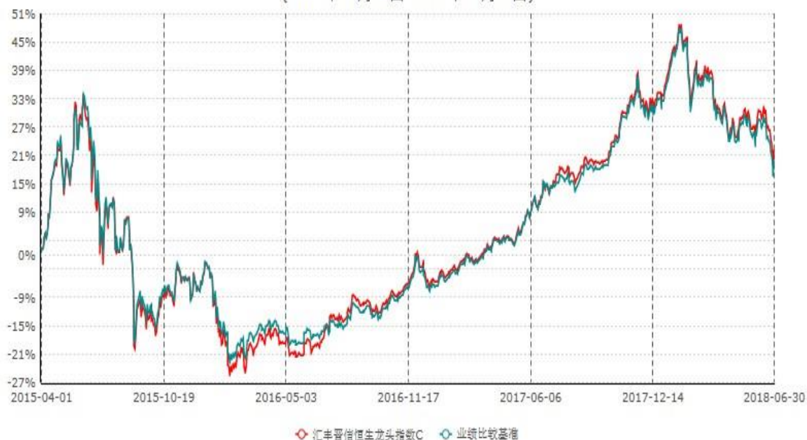
汇丰晋信恒生龙头指数C累计净值增长率与业绩比较基准收益率历史走势对比图 (2015年04月01日-2018年06月30日)

注：1. 按照基金合同的约定，本基金的投资组合比例为：投资于标的指数的成份股与备选成份股的组合比例不低于基金资产净值的 90%，现金（不包括结算备付金、存出保证金、应收申购款等）或到期日在一年以内的政府债券的比例不低于基金资产净值的 5%。本基金自基金合同生效日起不超过三个月内完成建仓。