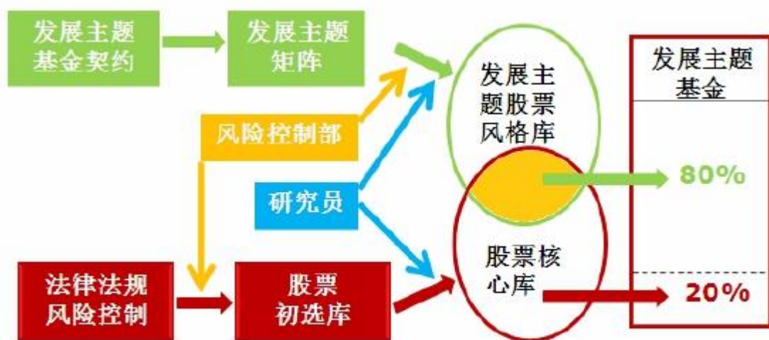
图发展主题基金股票选择流程

本基金股票投资组合的成份股的股票精选流程见下图。本基金股票投资的 80% 及以上部分来自于发展主题基金股票风格库和公司股票核心库的交集，其余的 20% 及以下的部分来自于公司股票核心库中的其他品种。这两部分股票将构成本基金的投资组合。