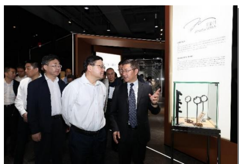
深圳市委书记王伟中莅临参观

报告期内，深圳市领导多次莅临飞亚达计时文化中心。此外，计时文化中心获评深圳市科普教育基地、深圳市工业展馆联盟副理事长单位、南山儿童科普联盟成员单位，并加入深圳市科普教育基地联合会，成为全市公民学习了解腕表文化、了解工匠精神的重要课堂。