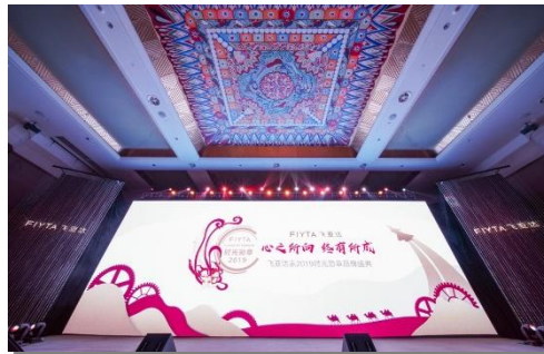
飞亚达时光勋章盛典

报告期内，深圳市领导多次莅临飞亚达计时文化中心。此外，计时文化中心获评深圳市科普教育基地、深圳市工业展馆联盟副理事长单位、南山儿童科普联盟成员单位，并加入深圳市科普教育基地联合会，成为全市公民学习了解腕表文化、了解工匠精神的重要课堂。