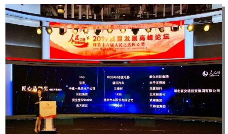
人民网2019年度匠心品牌