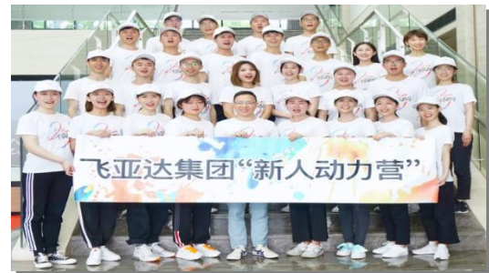
飞亚达 2019 年新员工风采