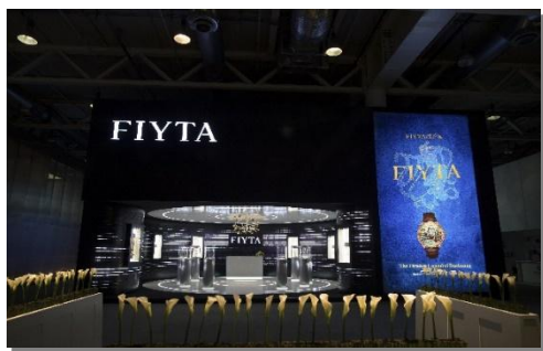
飞亚达参加巴塞尔钟表展

2019年，公司在努力做好经营的同时，继续不断传播钟表文化。亨吉利公司通过名表节的方式，分享和传播名表文化、時計文明和艺术。飞亚达表通过参加瑞士巴塞尔钟表展、香港钟表展及深圳钟表展，举办时光勋章盛典等方式在国内外传递腕表品牌与技术魅力。