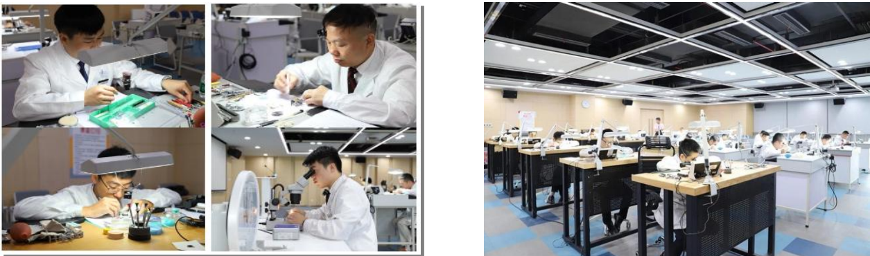
飞亚达公司维修技能竞赛

公司通过举办专业技能比拼赛事、学习交流会议，推进岗位学习，创造良好工作、学习与发展环境，人尽其才，致力于打造一支素质过硬的员工队伍。