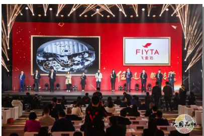
新中国成立70周年70品牌

公司自成立以来始终坚持依法诚信纳税，尽企业应尽的社会责任。2019 年，公司纳税额合计 2.63 亿元。报告期内，公司通过各方面不断努力，赢得了社会各界的广泛认可，荣获“新中国成立 70 周年 70 品牌”、“国家知识产权优势企业”、“人民网 2019 年度匠心品牌”、“深圳知名品牌”、“深圳行业领袖百强企业”等奖项及称号。