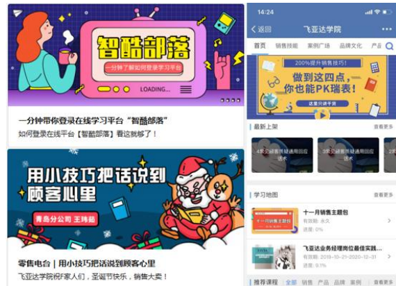
线上平台“飞亚达零售电台”项目