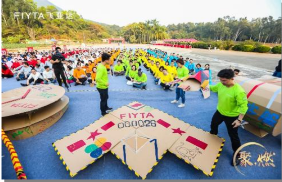
品牌群户外拓展训练

为进一步丰富和活跃员工业余文化生活，公司每年组织户外拓展训练、节庆文娱等活动，让员工拥有沟通表现舞台，增强团队凝聚力。