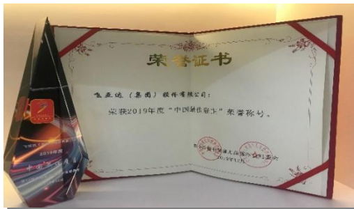
飞亚达“最佳雇主”荣誉展示

2019 年度，公司在“中国人力资源管理年度盛典”上连续十四次蝉联“中国年度最佳雇主”称号，公司始终不忘初心，牢记使命，在践行大国品牌的征途中为员工提供舞台，在雇主品牌建设的道路上砥砺前行。公司坚持在各大院校开展实习生招聘计划和新员工招聘计划，不断吸引优秀青年的加入。