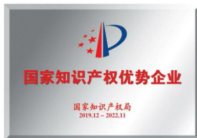
国家知识产权优势企业