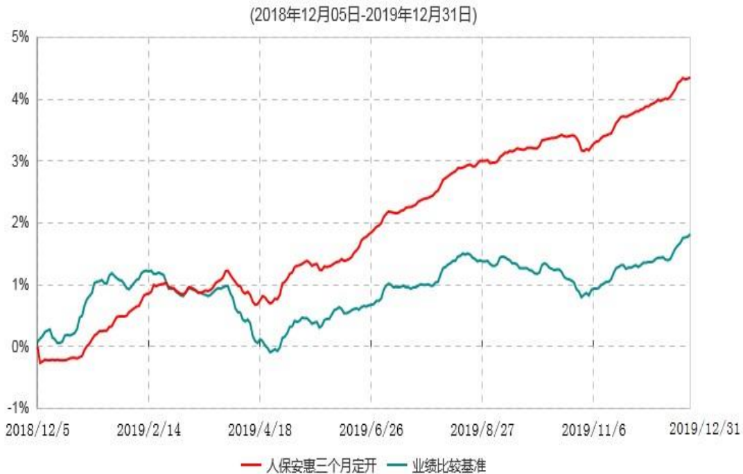
人保安惠三个月定期开放债券型发起式证券投资基金累计净值增长率与业绩比较基准收益率历史走势对比图

注：1、本基金基金合同于2018年12月5日生效。根据基金合同规定，本基金建仓期为6个月，建仓期满，本基金的各项投资比例符合基金合同的有关约定。