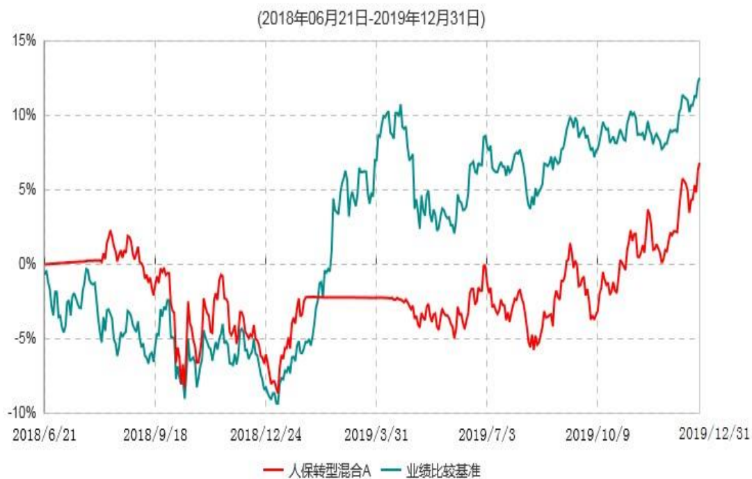
人保转型混合A累计净值增长率与业绩比较基准收益率历史走势对比图