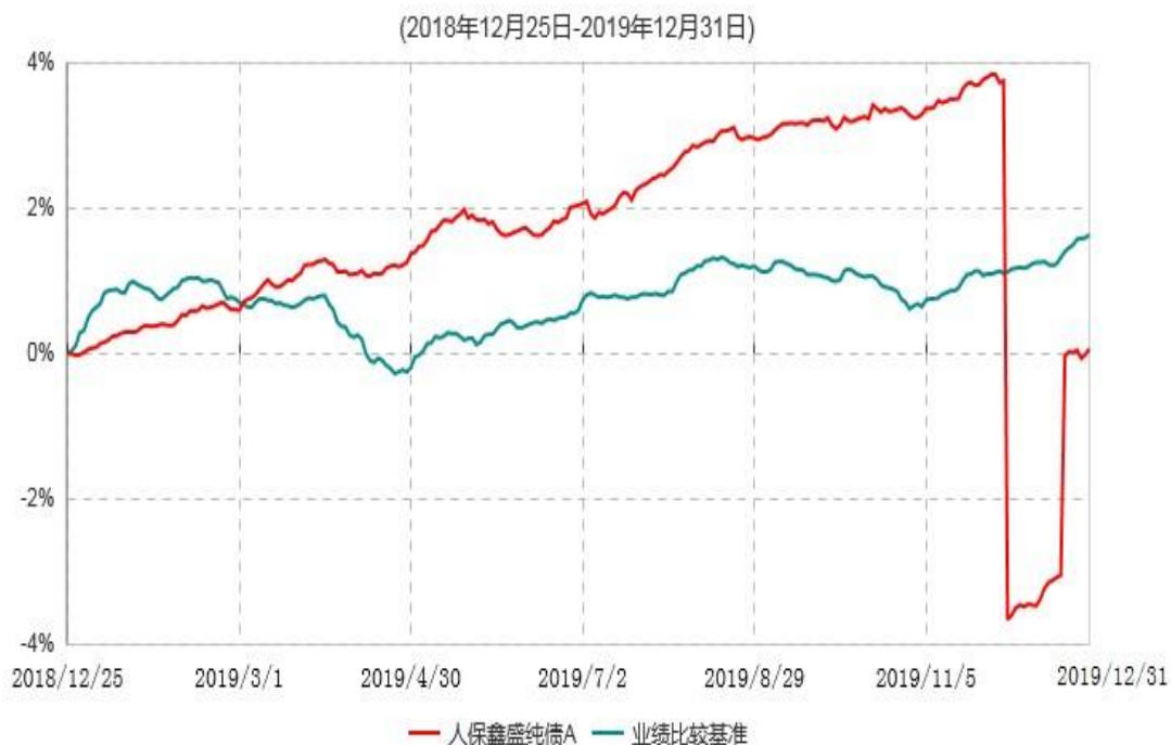
人保鑫盛纯债A累计净值增长率与业绩比较基准收益率历史走势对比图