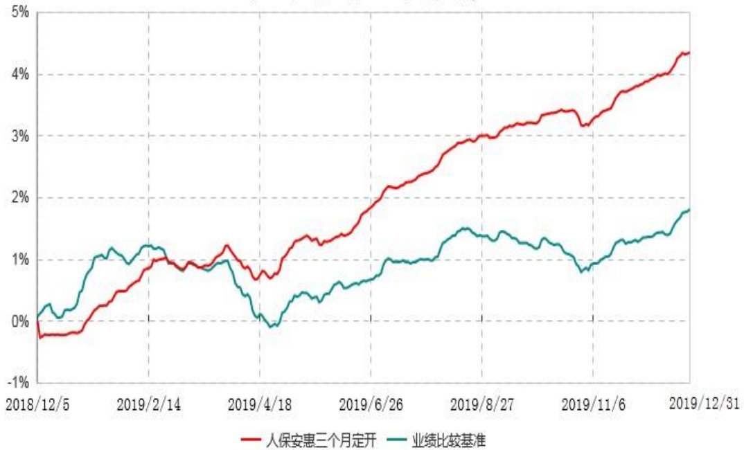
人保安惠三个月定期开放债券型发起式证券投资基金累计净值增长率与业绩比较基准收益率历史走势对比图 (2018年12月05日-2019年12月31日)