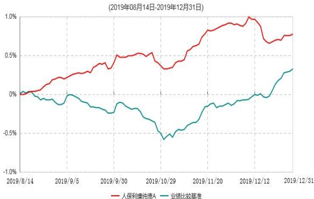
人保利璟纯债C累计净值增长率与业绩比较基准收益率历史走势对比图