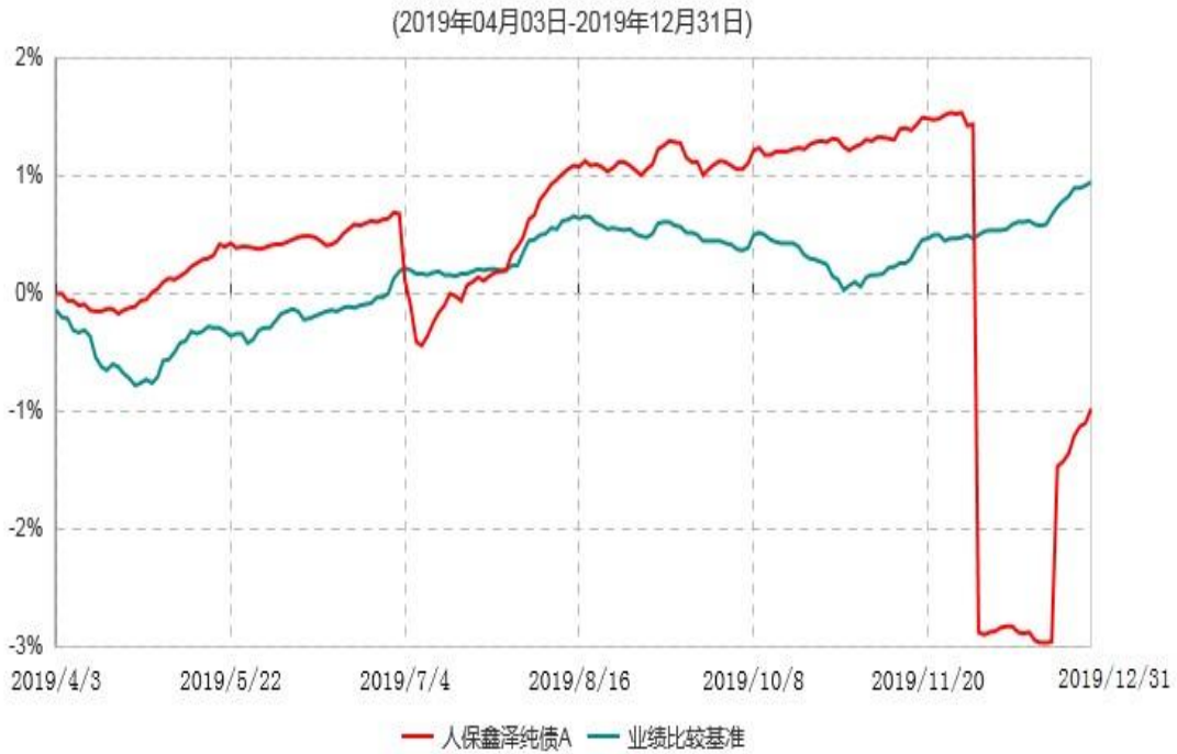
人保鑫泽纯债A累计净值增长率与业绩比较基准收益率历史走势对比图