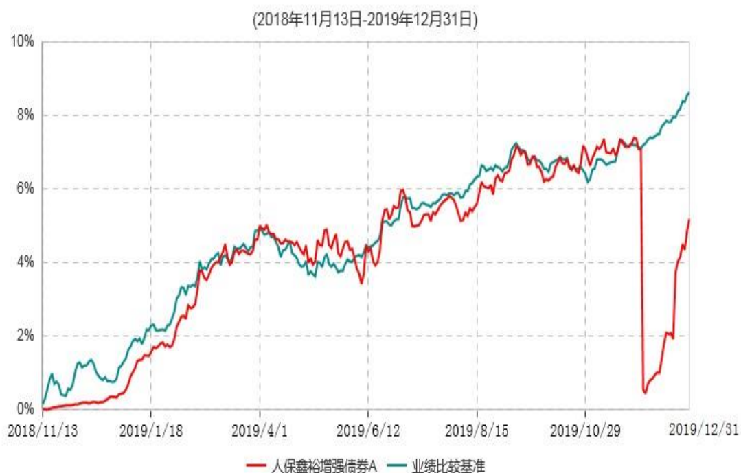
人保鑫裕增强债券A累计净值增长率与业绩比较基准收益率历史走势对比图