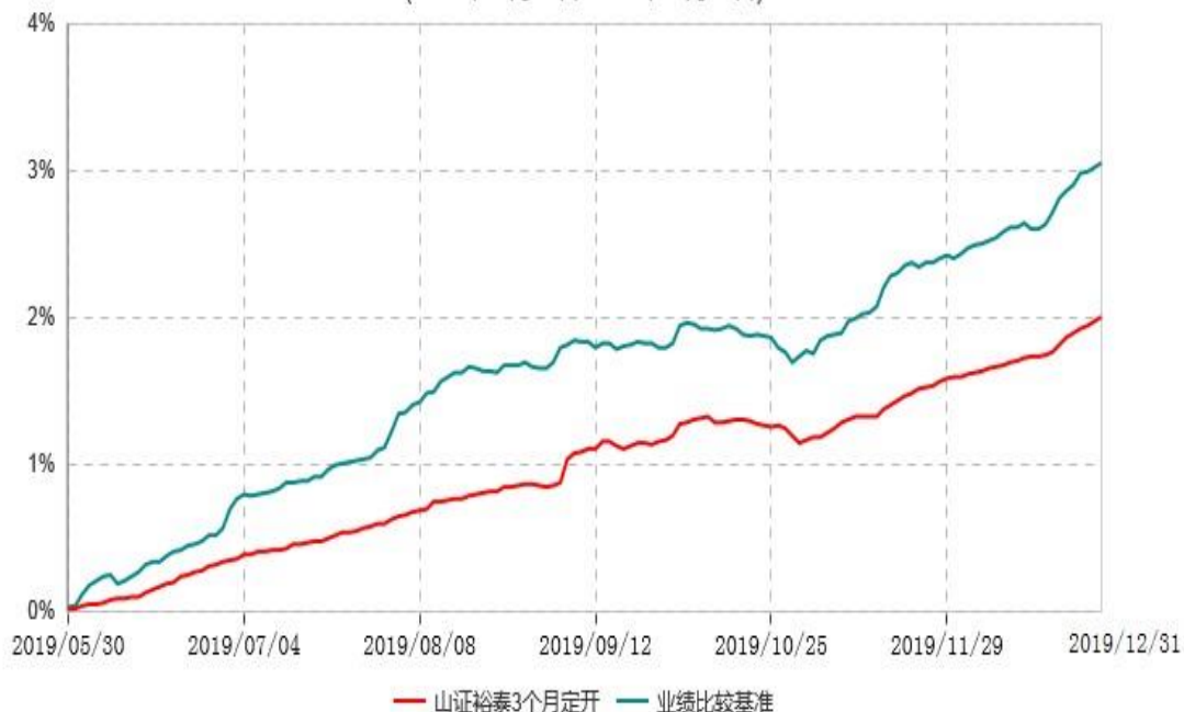
山西证券裕泰3个月定期开放债券型发起式证券投资基金累计净值增长率与业绩比较基准收益率历史走势对比图 (2019年05月30日-2019年12月31日)

注：1、本基金基金合同生效日为2019年5月30日，至本报告期末，本基金运作时间未 满一年；