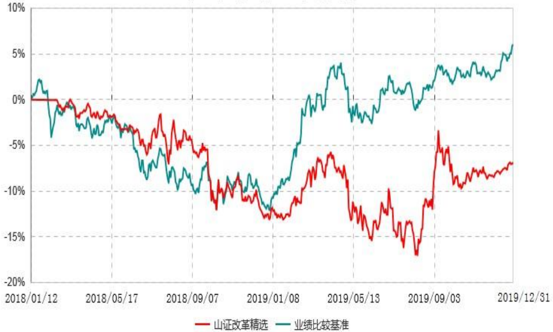
山西证券改革精选灵活配置混合型证券投资基金累计净值增长率与业绩比较基准收益率历史走势对比图 (2018年01月12日-2019年12月31日)

注：1、本基金基金合同生效日为2018年1月12日； 2、按基金合同和招募说明书的约定，基金管理人自基金合同生效之日起六个月内使基金的各项资产配置比例符合基金合同的有关约定。建仓期结束时各项资产配置比例符合基金合同的有关约定。本报告期内，本基金的各项投资比例达到基金合同约定的各项比例要求。