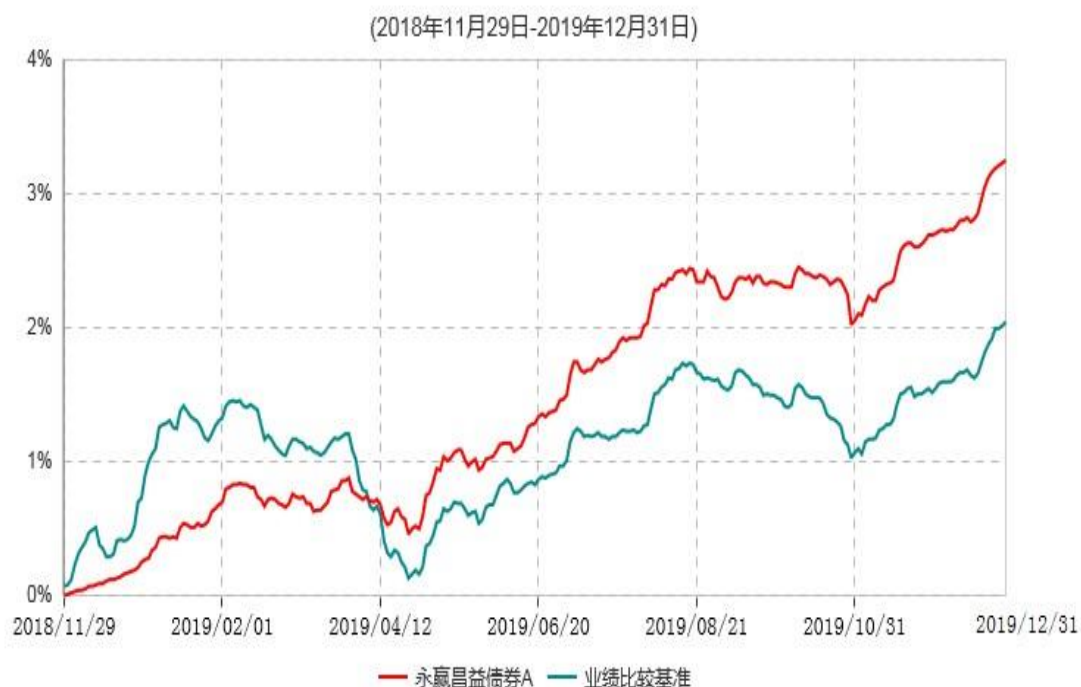
永赢昌益债券A累计净值增长率与业绩比较基准收益率历史走势对比图