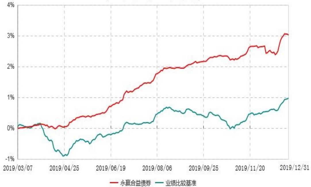
永赢合益债券型证券投资基金累计净值增长率与业绩比较基准收益率历史走势对比图 (2019年03月07日-2019年12月31日)

注：1、本基金合同生效日为2019年3月7日，截至本报告期末本基金合同生效未满1年； 2、本基金在六个月建仓期结束时，各项资产配置比例符合合同约定。