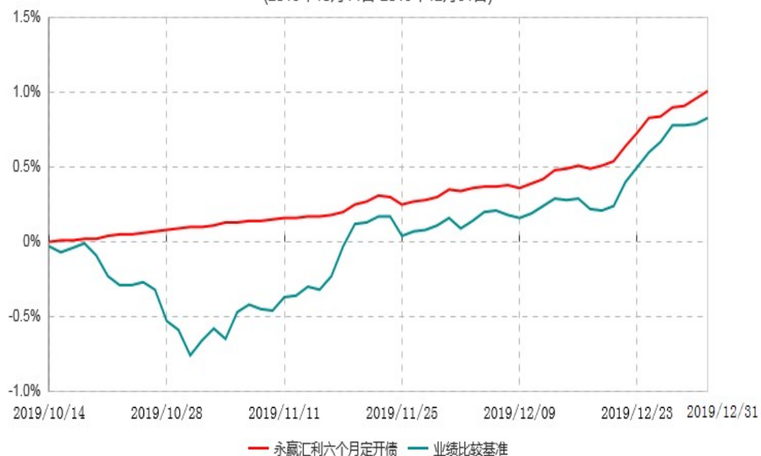
永赢汇利六个月定期开放债券型证券投资基金累计净值增长率与业绩比较基准收益率历史走势对比图 (2019年10月14日-2019年12月31日)

注：1、本基金合同生效日为2019年10月14日，截至本报告期末本基金合同生效未满1年； 2、本基金建仓期为本基金合同生效日起6个月，截至本报告期末，本基金尚处于建仓期中。