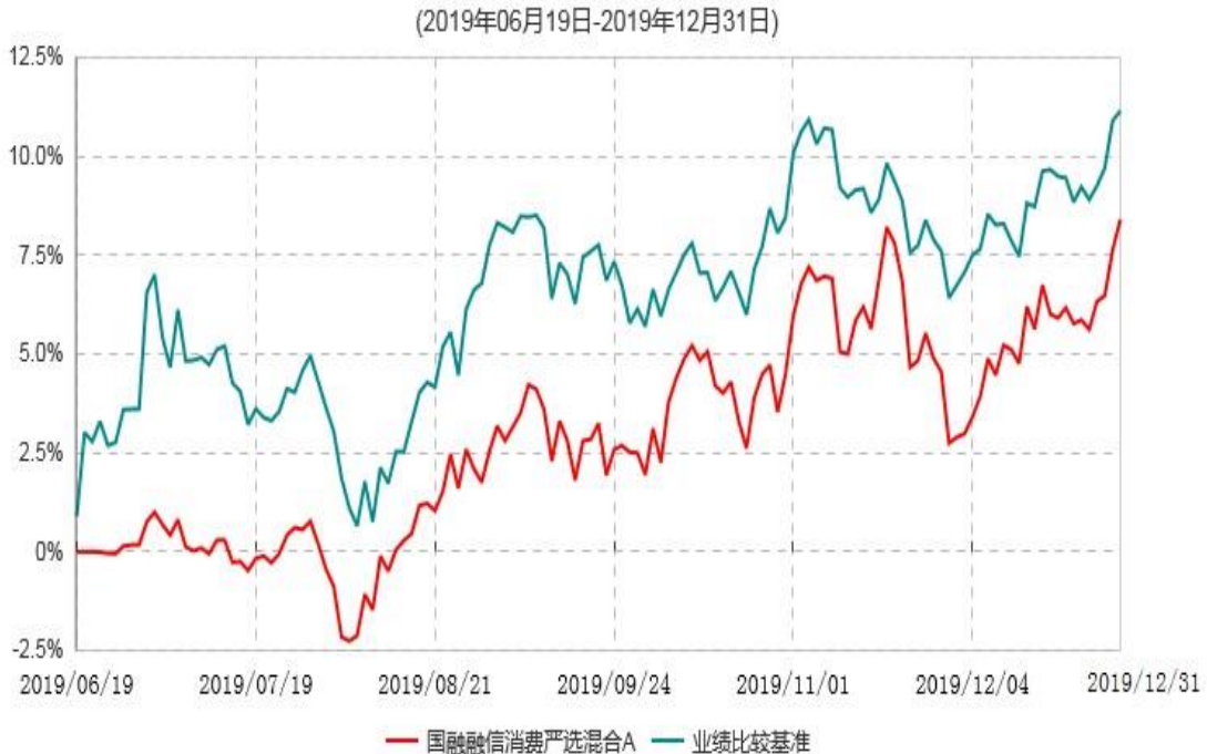
国融融信消费严选混合A累计净值增长率与业绩比较基准收益率历史走势对比图