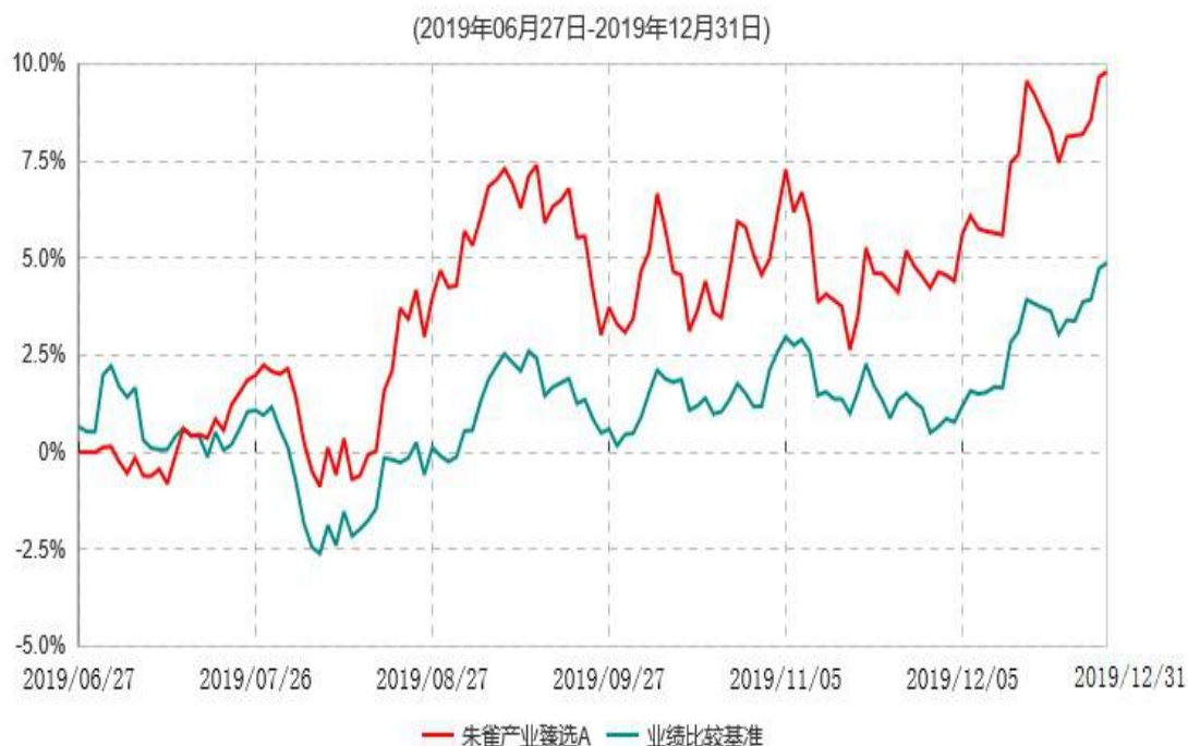
朱雀产业臻选A累计净值增长率与业绩比较基准收益率历史走势对比图