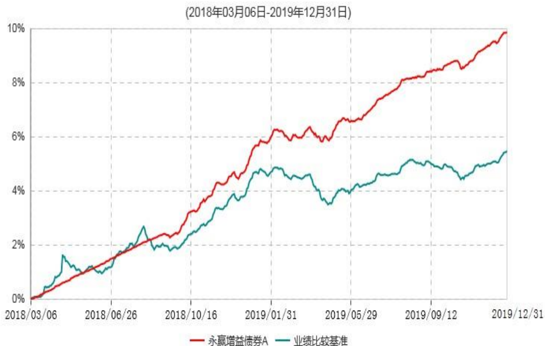
永赢增益债券A累计净值增长率与业绩比较基准收益率历史走势对比图

注：本基金建仓期为本基金合同生效日起 6 个月，建仓期结束当日，除债券投资比例未达到合同约定外，其他各项资产配置符合合同约定。债券投资比例未达到合同约定系交易对手原因导致现券买入交易结算失败所致，本基金于 2018 年 9 月 6 日及时买入债券将债券投资比例提高至合同约定的范围内。