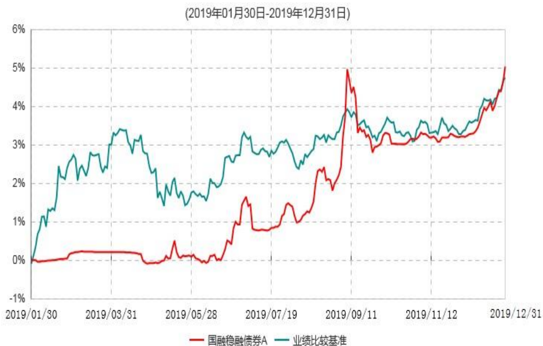
国融稳融债券A累计净值增长率与业绩比较基准收益率历史走势对比图