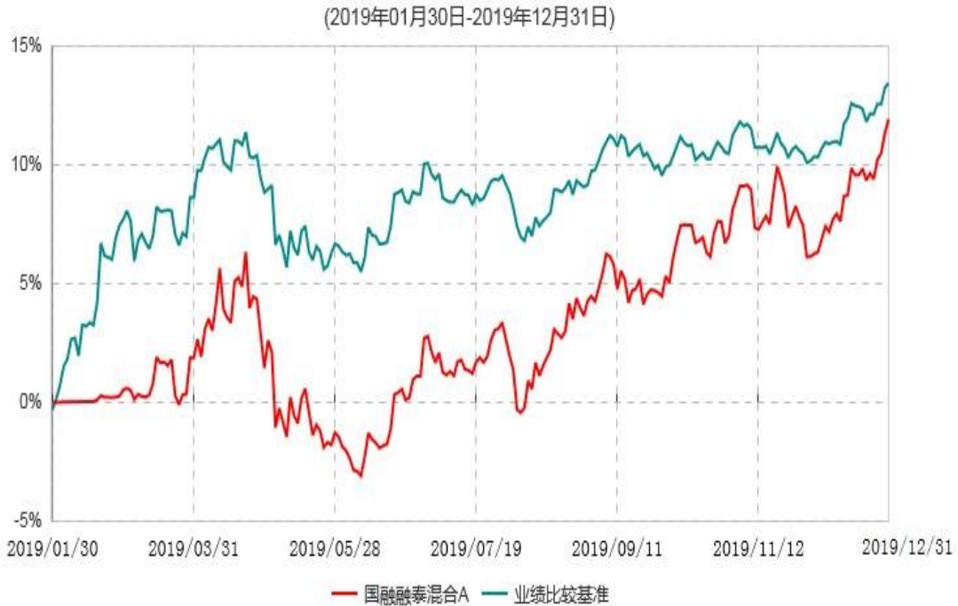
国融融泰混合A累计净值增长率与业绩比较基准收益率历史走势对比图