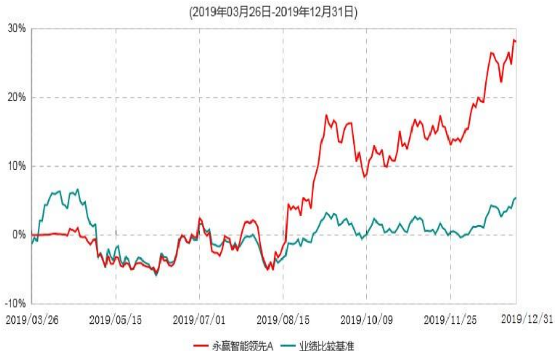
永赢智能领先A累计净值增长率与业绩比较基准收益率历史走势对比图

注：1、本基金合同生效日为 2019 年 3 月 26 日，截至本报告期末本基金合同生效未满 1 年；