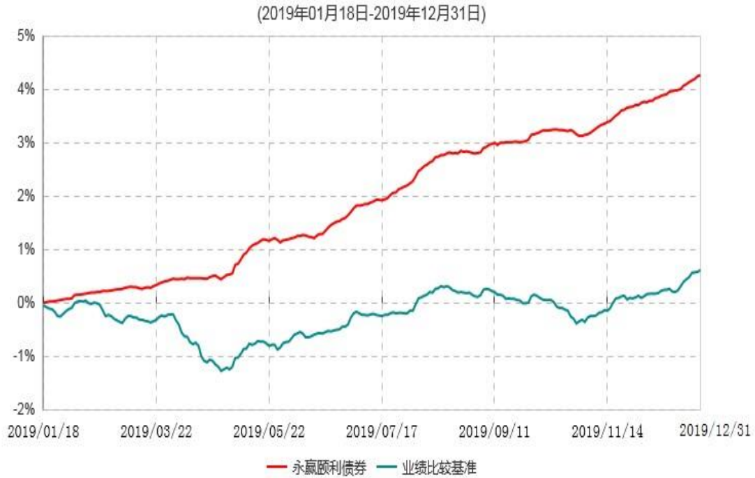
永赢颐利债券型证券投资基金累计净值增长率与业绩比较基准收益率历史走势对比图

注：1、本基金合同生效日为2019年1月18日，截至本报告期末本基金合同生效未满1年； 2、本基金在六个月建仓期结束时各项资产配置比例符合合同约定。