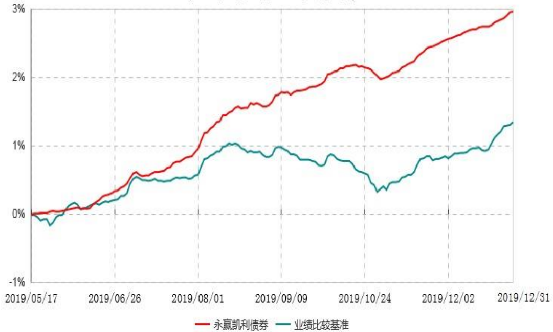
永赢凯利债券型证券投资基金累计净值增长率与业绩比较基准收益率历史走势对比图 (2019年05月17日-2019年12月31日)

注：1、本基金合同生效日为2019年5月17日，截至本报告期末本基金合同生效未满1年； 2、本基金在六个月建仓期结束时各项资产配置比例符合合同约定。