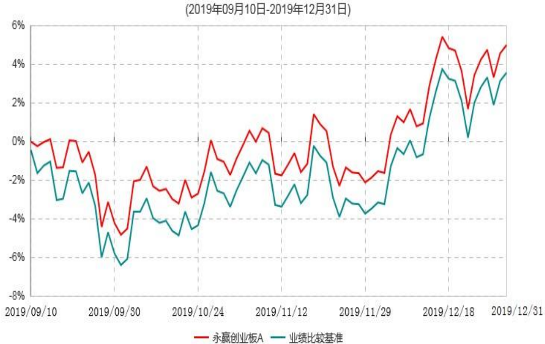
永赢创业板A累计净值增长率与业绩比较基准收益率历史走势对比图

注：1、本基金合同生效日为 2019 年 9 月 10 日，截至本报告期末本基金合同生效未满 1 年；