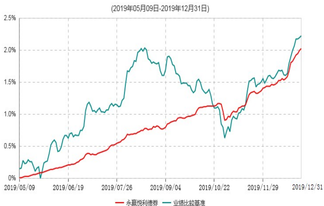
永赢悦利债券型证券投资基金累计净值增长率与业绩比较基准收益率历史走势对比图

注：1、本基金合同生效日为2019年5月9日，截至本报告期末本基金合同生效未满1年； 2、本基金在六个月建仓期结束时，各项资产配置比例符合合同规定。