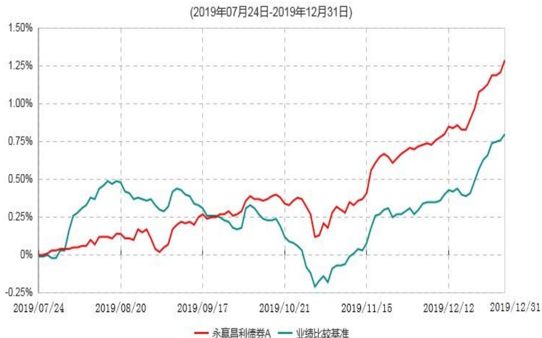
永赢昌利债券A累计净值增长率与业绩比较基准收益率历史走势对比图

注：1、本基金合同生效日为 2019 年 7 月 24 日，截至本报告期末本基金合同生效未满 1 年。 2、本基金建仓期为本基金合同生效日起 6 个月，截止本报告期末，本基金尚处于建仓期。