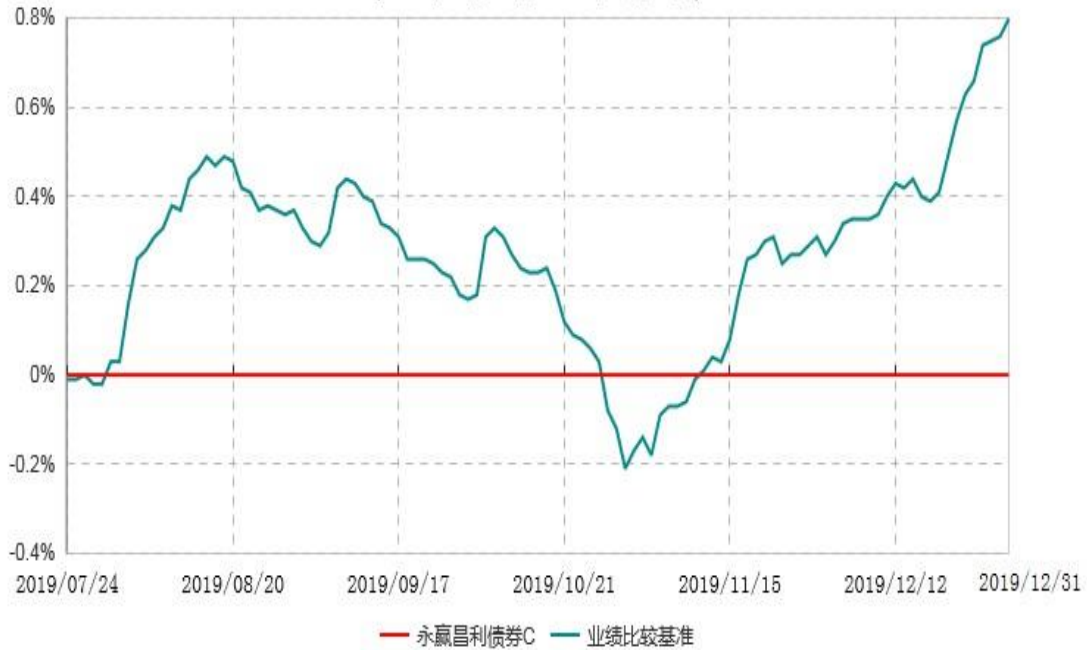
永赢昌利债券C累计净值增长率与业绩比较基准收益率历史走势对比图 (2019年07月24日-2019年12月31日)

注：1、本基金合同生效日为 2019 年 7 月 24 日，截至本报告期末本基金合同生效未满 1 年。 2、本基金建仓期为本基金合同生效日起 6 个月，截止本报告期末，本基金尚处于建仓期。