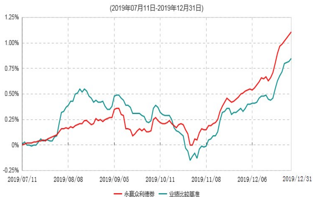
永赢众利债券型证券投资基金累计净值增长率与业绩比较基准收益率历史走势对比图

注：1、本基金合同生效日为2019年07月11日，截至本报告期末本基金合同生效未满1年； 2、本基金建仓期为本基金合同生效日起6个月，截至本报告期末，本基金尚处于建仓期中。