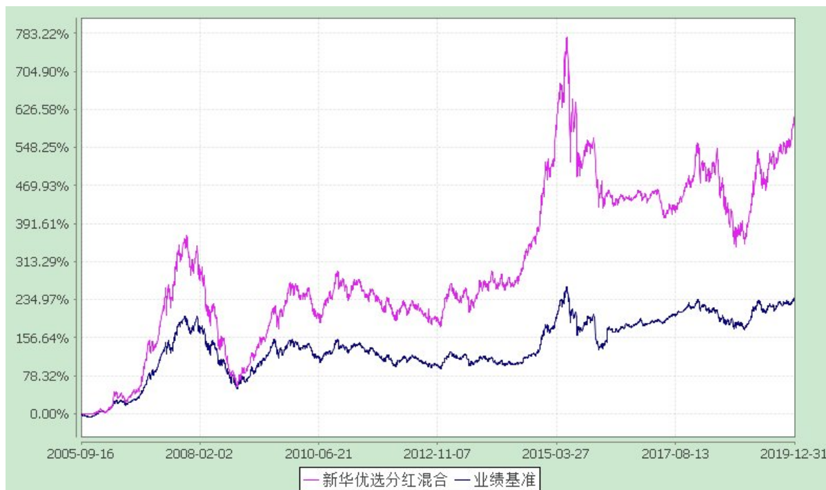
自基金合同生效以来份额累计净值增长率与业绩比较基准收益率的历史走势对比图 (2005 年 9 月 16 日至 2019 年 12 月 31 日)