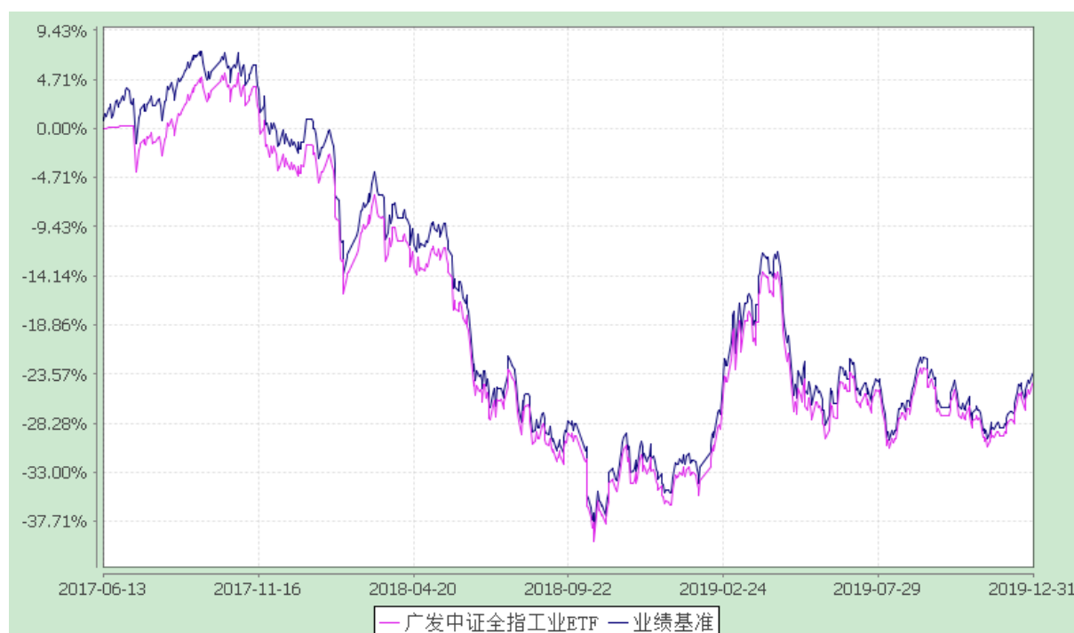
广发中证全指工业交易型开放式指数证券投资基金 份额累计净值增长率与业绩比较基准收益率的历史走势对比图 (2017年6月13日至2019年12月31日)