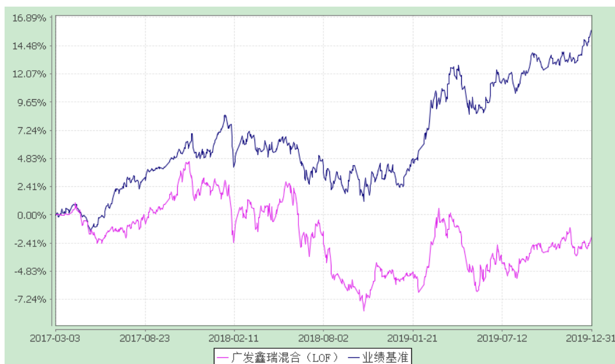
广发鑫瑞混合型证券投资基金（LOF） 份额累计净值增长率与业绩比较基准收益率的历史走势对比图 (2017 年 3 月 3 日至 2019 年 12 月 31 日)