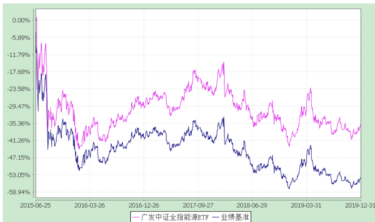
广发中证全指能源交易型开放式指数证券投资基金 份额累计净值增长率与业绩比较基准收益率的历史走势对比图 (2015 年 6 月 25 日至 2019 年 12 月 31 日)