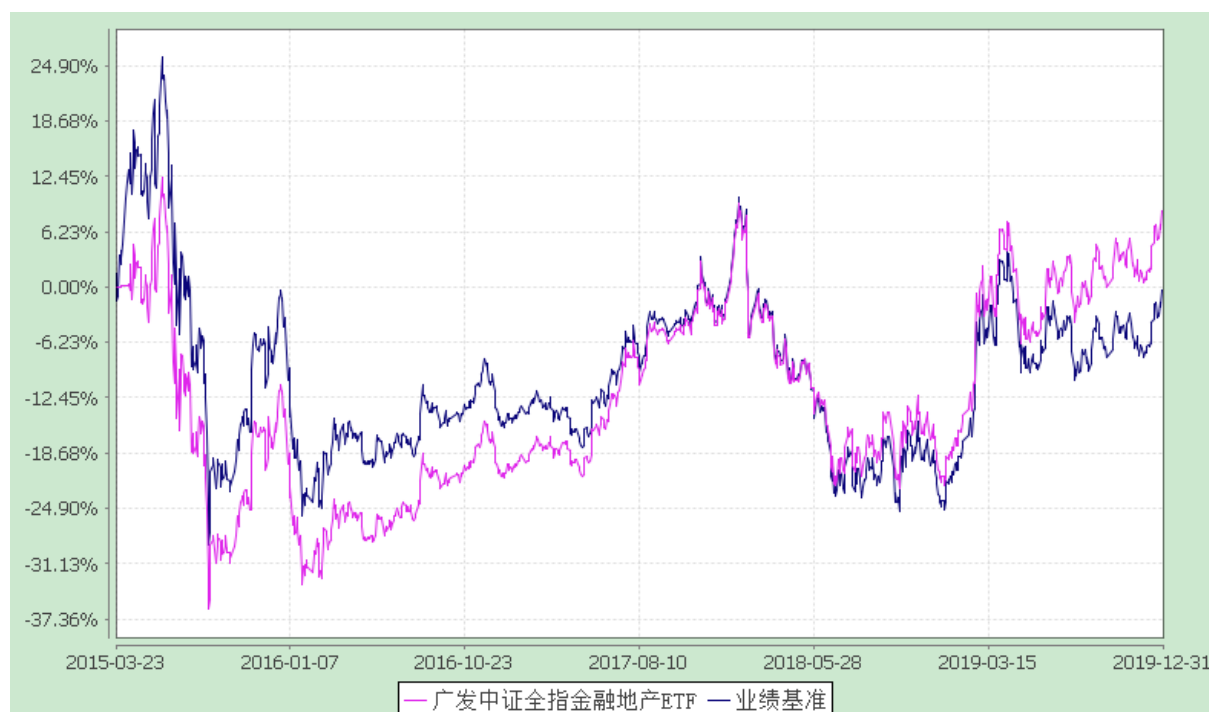
广发中证全指金融地产交易型开放式指数证券投资基金 份额累计净值增长率与业绩比较基准收益率的历史走势对比图 (2015 年 3 月 23 日至 2019 年 12 月 31 日)