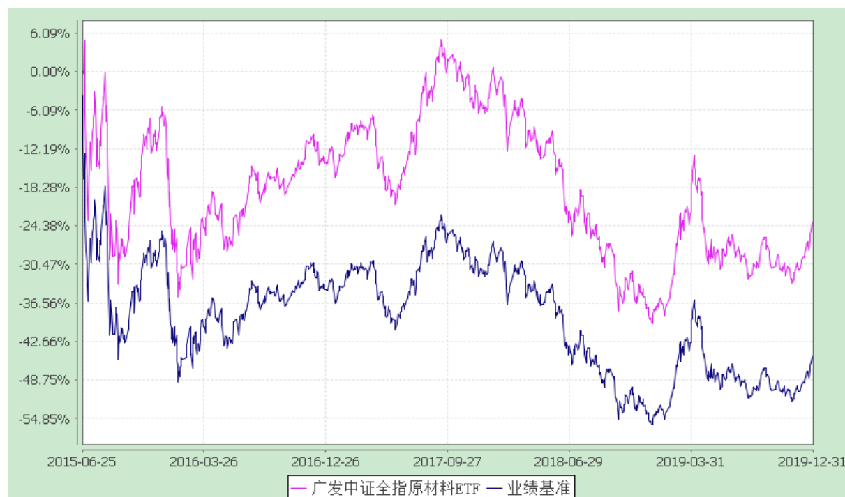
广发中证全指原材料交易型开放式指数证券投资基金 份额累计净值增长率与业绩比较基准收益率的历史走势对比图 (2015年6月25日至2019年12月31日)