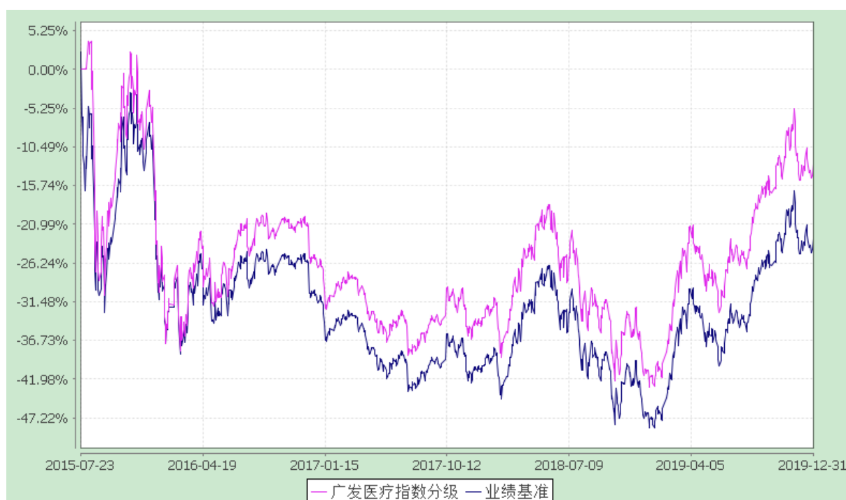
广发中证医疗指数分级证券投资基金 份额累计净值增长率与业绩比较基准收益率的历史走势对比图 (2015年7月23日至2019年12月31日)