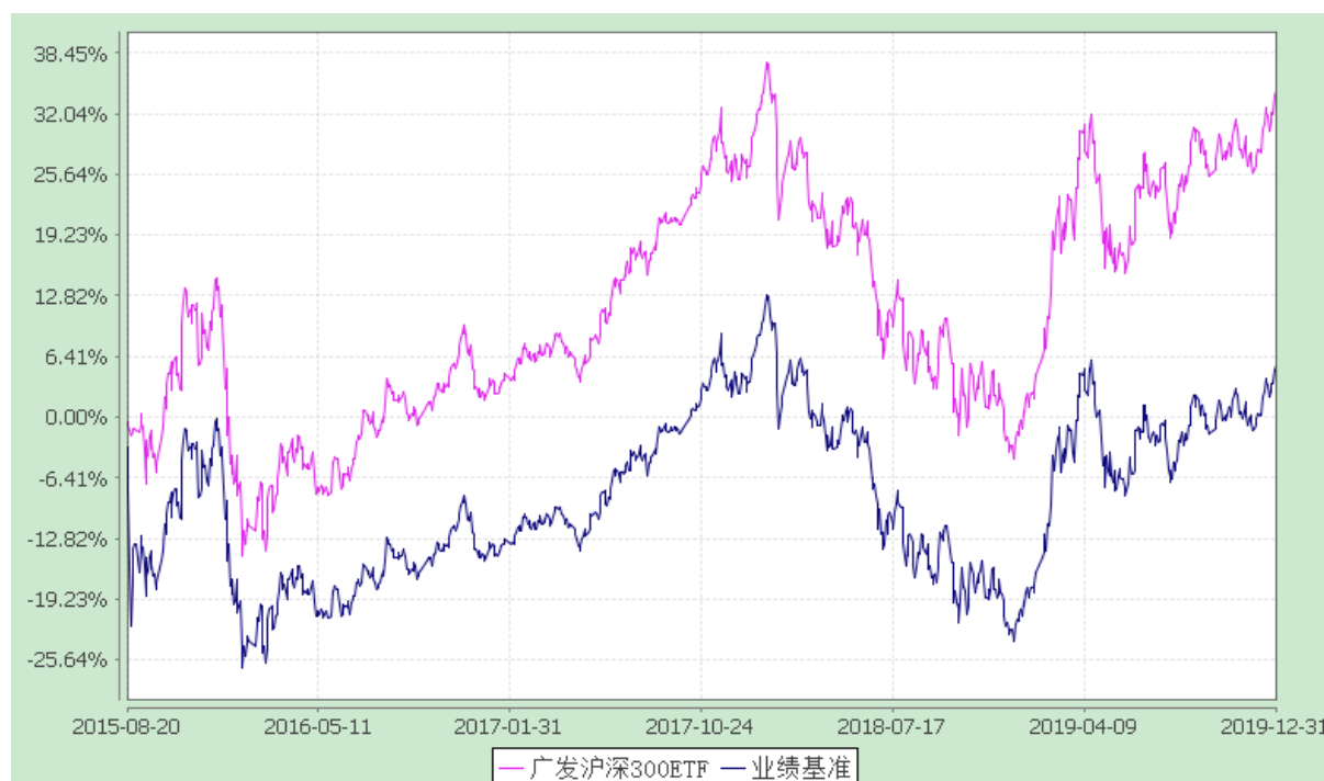
广发沪深 300 交易型开放式指数证券投资基金 份额累计净值增长率与业绩比较基准收益率的历史走势对比图 (2015 年 8 月 20 日至 2019 年 12 月 31 日)