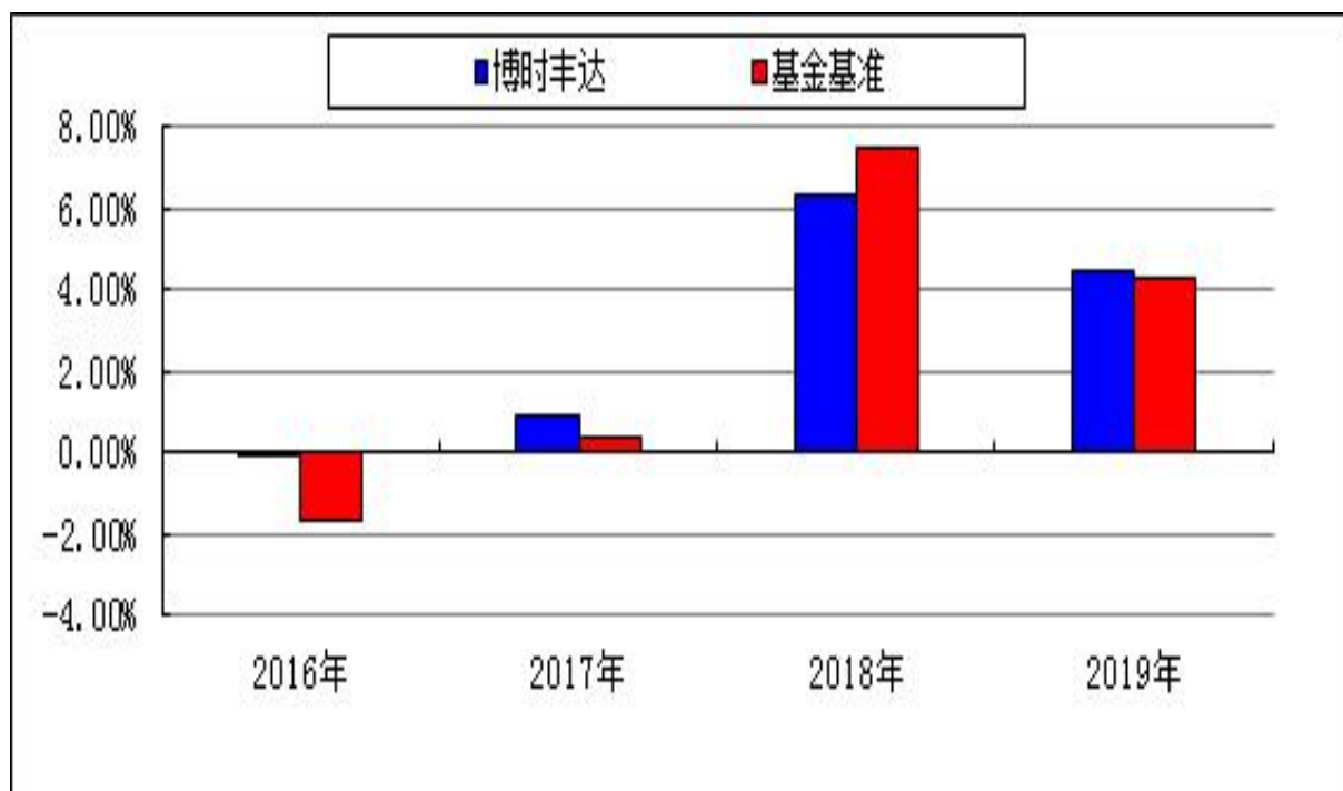
自基金合同生效以来基金净值增长率与业绩比较基准收益率的对比图

注：本基金的基金合同于 2016 年 11 月 7 日生效,合同生效当年按实际存续期计算,不按整个自然年度进行折算。