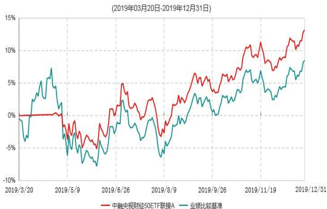
中融央视财经50ETF联接A累计净值增长率与业绩比较基准收益率历史走势对比图