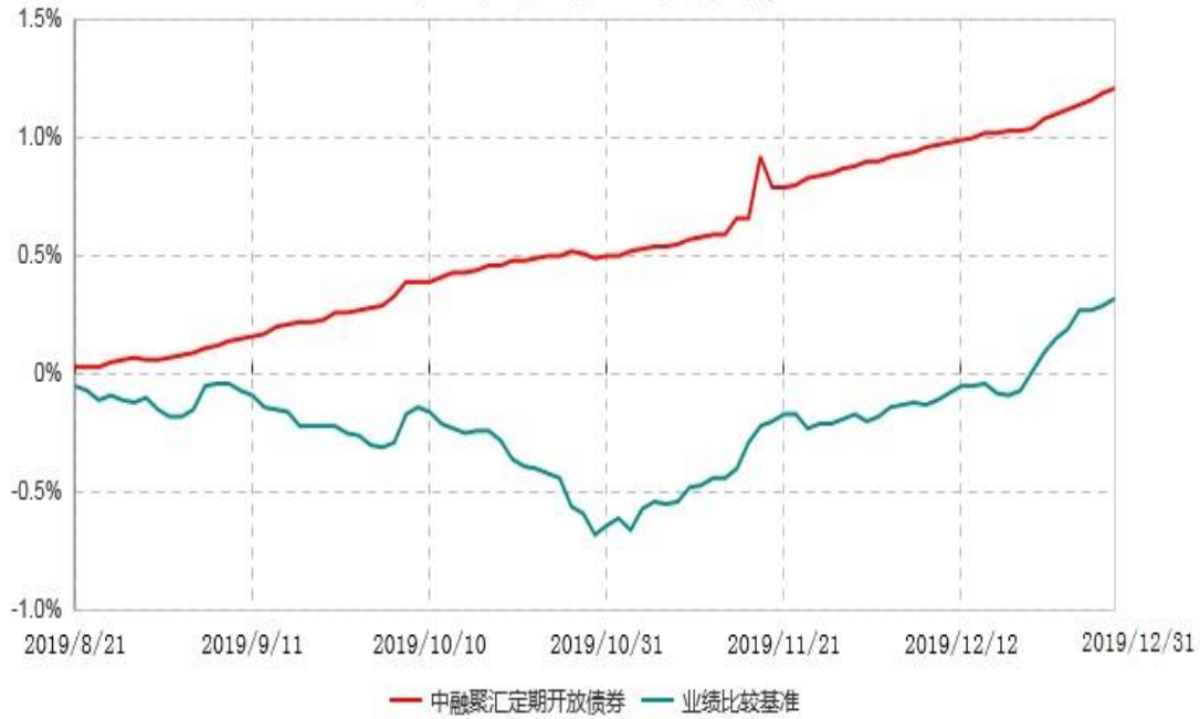
中融聚汇3个月定期开放债券型发起式证券投资基金累计净值增长率与业绩比较基准收益率历史走势对比图 (2019年08月21日-2019年12月31日)

注：按基金合同和招募说明书的约定，本基金自合同生效日起6个月内为建仓期，截至本报告期末仍在建仓期内。