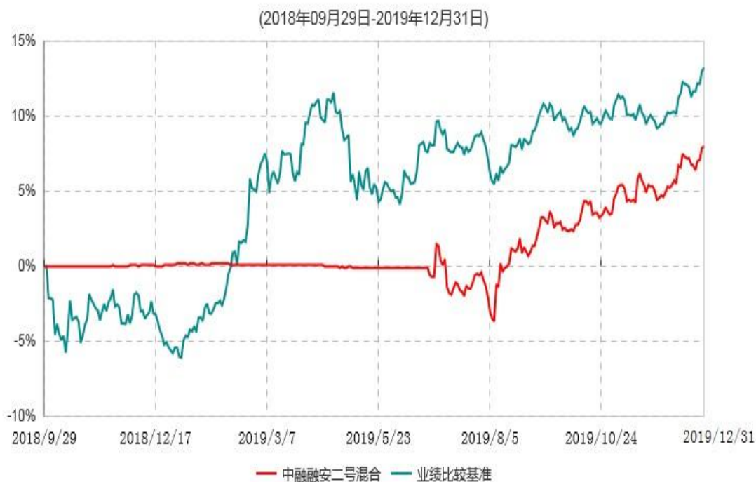
中融融安二号灵活配置混合型证券投资基金累计净值增长率与业绩比较基准收益率历史走势对比图

注：中融融安二号保本混合型证券投资基金从2018年9月29日起转型为中融融安二号灵活配置混合型证券投资基金，按照基金合同和招募说明书的约定，中融融安二号灵活配置混合型证券投资基金自转型日起6个月内为建仓期，建仓期结束时本基金的各项资产配置比例符合基金合同的有关约定。