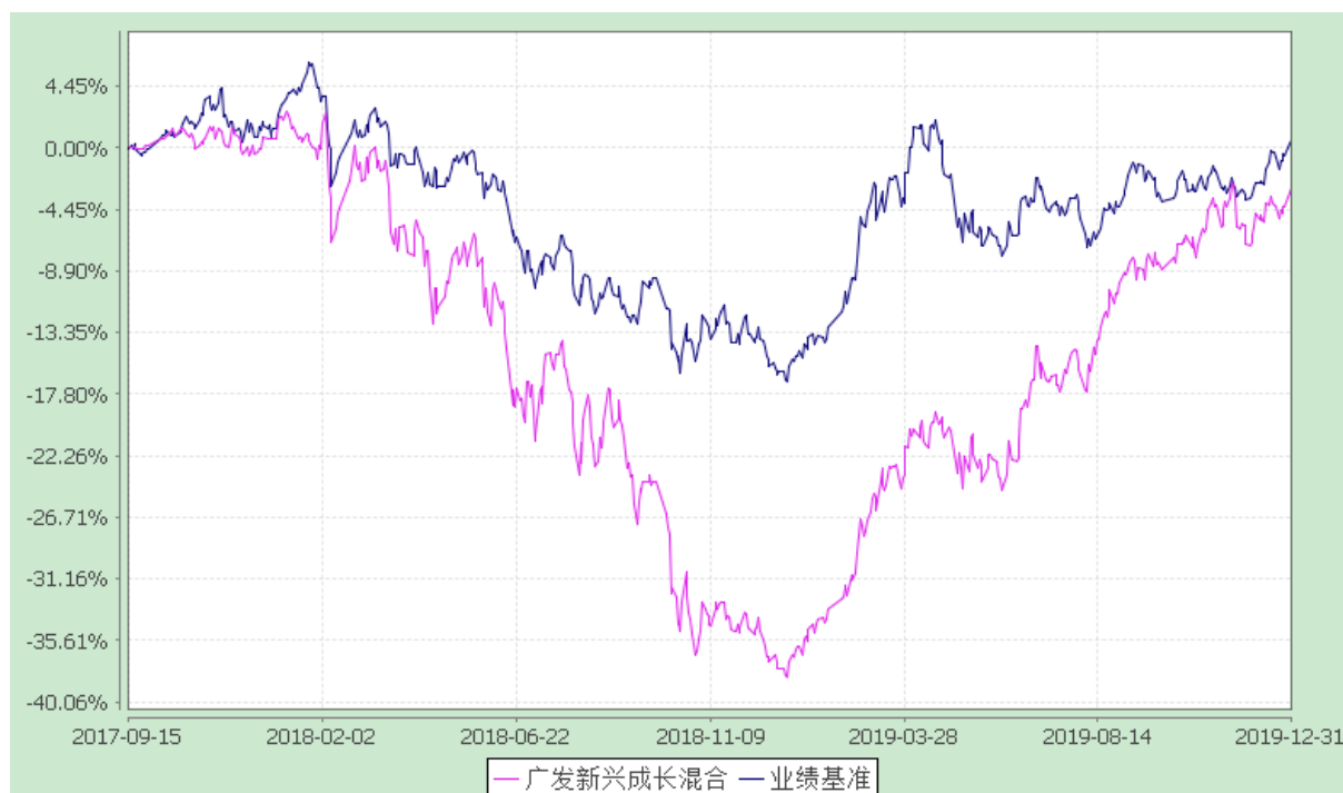
广发新兴成长灵活配置混合型证券投资基金 份额累计净值增长率与业绩比较基准收益率的历史走势对比图 (2017 年 9 月 15 日至 2019 年 12 月 31 日)