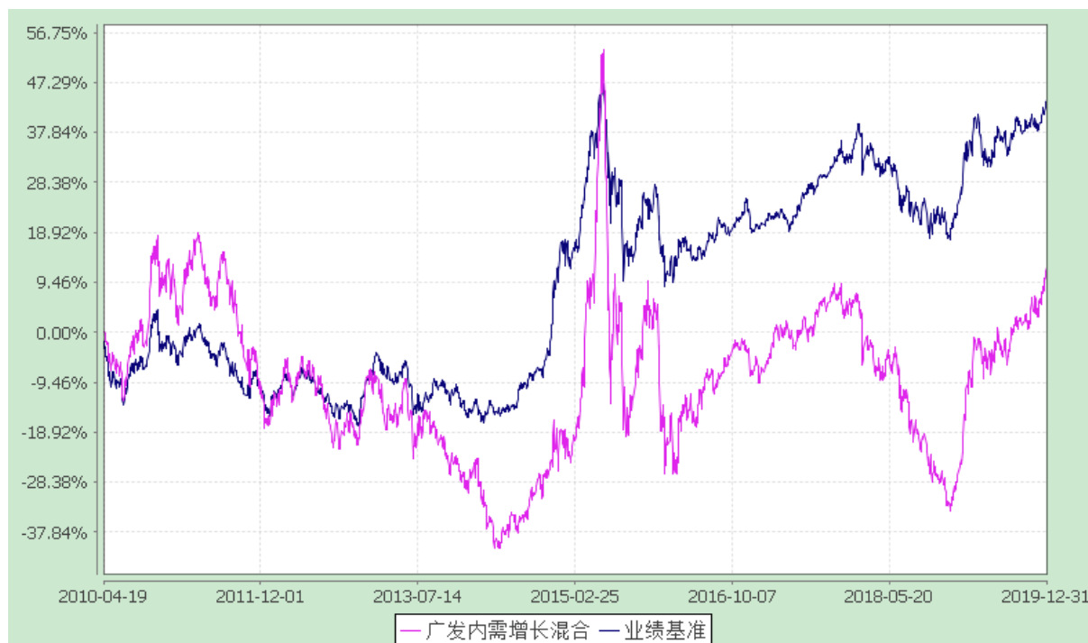
广发内需增长灵活配置混合型证券投资基金 份额累计净值增长率与业绩比较基准收益率的历史走势对比图 (2010 年 4 月 19 日至 2019 年 12 月 31 日)